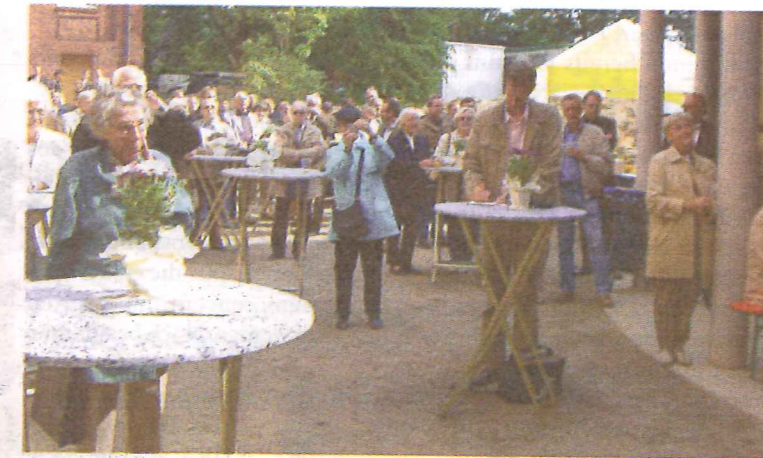
Am 15. Mai 2007 feierten 120 Handwerker und Bauleute zusammen mit mehr als 100 interessierten Senioren sowie mit Vertretern des Bezirks und des Sozial- und Gesundheitswesens das Richtfest.

Hier werden auf fünf Etagen neben 131 Zimmern der vollstationären Pflege 40 weitere komfortable Appartements für das Betreute Wohnen hergerichtet. Diese befinden sich im Südflügel des Hauses und sind durch eine Doppeltür vom restlichen Gebäude abgetrennt. Die Wohnungen werden genauso ausgestattet sein, wie die Wohnungen im Altbau, verfügen darüber hinaus aber über einen Balkon, einen Glaserker oder eine schöne Terrasse. Sie sind zwischen 40 und 80 Quadratmeter groß; die Zimmer im Pflegebereich zwischen 13 und 20 Quadratmeter. Die Miete der Betreuten Appartements liegt inkl. der Nebenkosten und der Betreuungsleistungen zwischen 800 und 1600 Euro pro Monat.