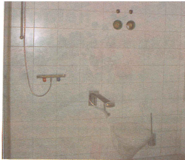
Die Betreuten Appartements verfügen über eine schöne Einbauküche, moderne, barrierefreie Sanitäranlagen und eine Rufvorrichtung, über die rund um die Uhr Hilfe angefordert werden kann.