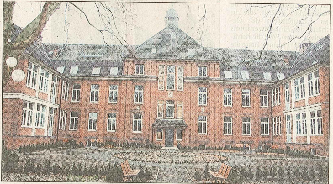
Das alte AK hat sich von außen kaum verändert. Im Sommer lockt der ehemalige Patientengarten.

Das denkmalgeschützte, 1912 errichtete AK hatte zuletzt die Psychiatrie beheimatet. „Wir haben dem Gebäude seinen ursprünglichen Charakter zurückgegeben, die vergitterten Fenster entfernt“, erläutert Eichentopf. Viele Details haben Planer und Denkmalschützer abgestimmt, „die Beratungen